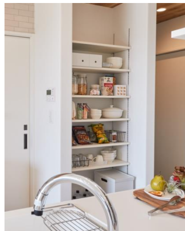
キッチンの扉の無い収納スペース