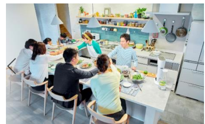
仲間と過ごす空間