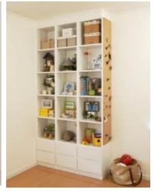
伝える力 「作品ギャラリー」