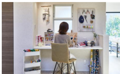
一人で過ごす空間