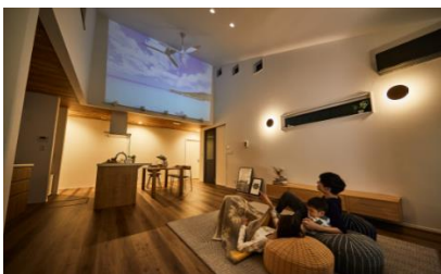
家族と過ごす空間

新しい生活スタイルにより、家で家族の関わり方が変化しています。一人ひとりの時間や過ごし方を尊重し、それぞれの心地良い場所があってこそ、より家族の絆が深まると考えます。アイフルホームでは「家族と過ごす空間」「一人で過ごす空間」「仲間と過ごす空間」の3つの空間から「家族の絆」が育まれると考えています。