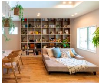
感じる力 「本に囲まれる」

「子育てをする」のではなく「子が育つ暮らし」へ、子ども自ら、自分や地球の未来を考えて好きを見つけることができ、親は楽しく見守れる提案を行います。アイフルホームでは「子が育つ暮らし」により育まれる力を「感じる力」「考える力」「伝える力」の3つだと考え、それぞれの力を育める商品開発を行っています。